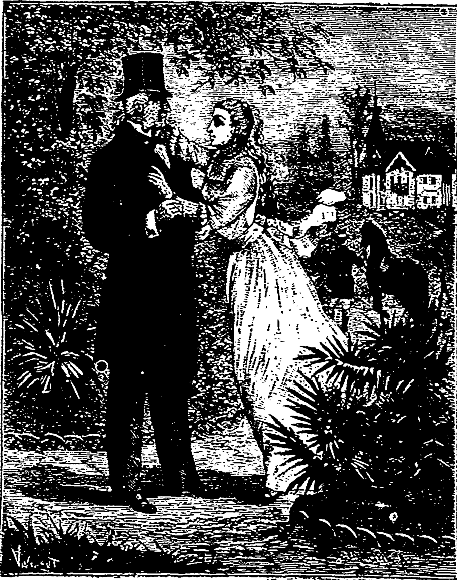
Le père et la fille étaient dans les bras l'un de l'autre.

Le misérable traça son nom et tendit la feuille à Paula.