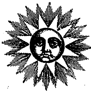
Le soleil se levait radieux à l'horizon.

Un homme de police fit son apparition dans la ruelle.