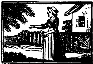
Le combat avait duré une vingtaine de minutes.

Bénoni était victorieux et son adversaire lui demandait grâce, lorsque tout-à-coup une vieille femme éveillée par les vociférations des combattants sortit de chez elle et se mit à appeler la police.