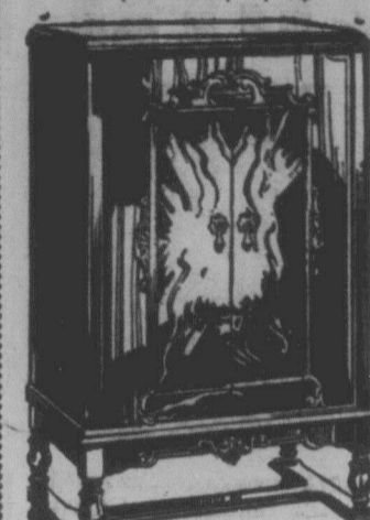
ВІКТОР-РАДІО КОМБІНЕЙШ'Н ЦІНА $397.50

"ВІКТОР-РАДІО" є збудоване після найлучших специфікацій і має всі удішення року 1931 з-дарини радія. Контроля тонів від басів до найвищих. Ці радія передають вам найвірніше всі репродукції навіть на найдалішій віддалі