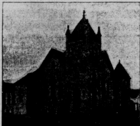
Skand. Missionskyrkan i Winnipeg.

Under året har stiftats en barnaförening som arbetat med framgång samt likaledes en syförening bland söndagskolbarnen.