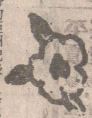
張大千故居博物院接管