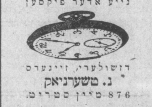
נייע אדער פיקסען דזשולערי, זיינערס נ. משערניאק 876 סטריט.

זעציע לייט געזוכט: זיך פאלד אויסלערנען די בארבער פרייר בלוז 8 וואכען פארערט זיך אויסלערנען נען. טולס פריי און ווירדעסעס אין לעהרע צייט. א שטעלע געווערעט פון $16 ביז $20 וועכענטליך. מיר האבען הונדערטע לאר קיישאנס, וואו איהר קענט זיך עפענען ביזנעס אליין. גרויסע פארערוגנע פיר באר בערס. שרייבט פאר אומזיסטע קאמפלאג בעסער קומט אליין. אויב איהר ווילט זיין א נוסער בארבער, מוזט איהר לערנען ביי The International Barber College אלעקסאנדער עוו. 1 מעטיר וועסט מיינסט.