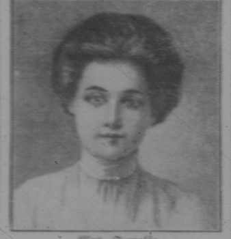
Frau Traut a-fraus

Der Krieg gegen Österreich ist längst beendet durch „Traut a-fraus“