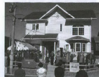
Une maison-témoin de Demtec International lors de l'inauguration, en novembre 2003, de son nouveau projet résidentiel à Kitakyushu, au Japon.

Demtec Inc., un promoteur reconnu de maisons préfabriquées établi à Princeville (Québec), se fait une place au soleil de l'autre côté de la planète avec un nouveau projet d'aménagement résidentiel qui apportera les toutes dernières technologies canadiennes en matière d'habitation à la ville méridionale de Kitakyushu, située sur l'île de Kyushu, au Japon.