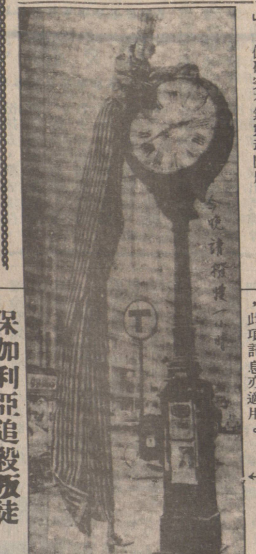
緬街某旅館腐屍案，主人被罰五十。

(本報訊) 雲市市政府昨在太陽報刊登公告有關「主日營業」法例。 該法例：「雲市市政府「星期日營業」公告：雲市議會已於一九七八年十月十七日決議，任何零售商店若在星期日開店營業者，可能被控違反「主日法案」。下列特准之商店則不在此限，計為(一)小型雜貨店(面積在一千二百平方英尺以下)。 藥房，書店，唱片店，紀念品商店。凡在市府地方「商店法案」第四組第一項規定列出之貨店不得陳列出售；(二)木廠，花店，苗圃；(三)華埠與煤氣鎮兩處歷史性地區之商店。 上述市議會之決議，由一九七八年十一月五日起生效。特此公告。 雲市市政府牌照局長赫拔。