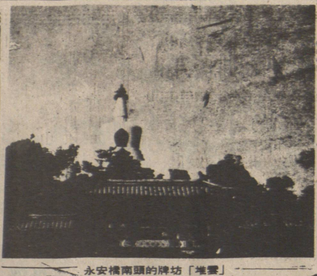
永安橋南頭的牌坊「地盤」

要將一個不足兩毫米的受精卵，置入子宮內，而又要其正常成長，這是一項極其複雜的技術，過去曾被認為是不可能的事情。 其實，「試管嬰兒」並非始終在試管中受孕成長的嬰兒，而是指在試管中受孕，體內懷胎的嬰兒。但是，要經過多個精密的步驟（見圖）： (一)