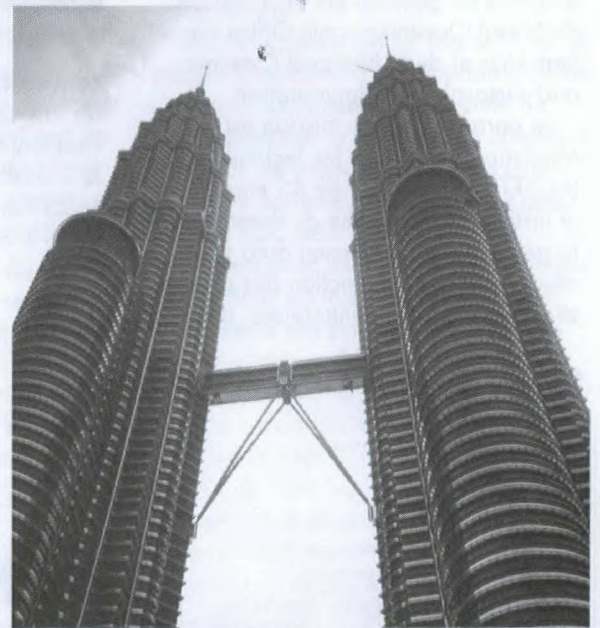
Les tours Petronas de Kuala Lumpur se dressent fièrement au cœur de l'Asie du Sud-Est.