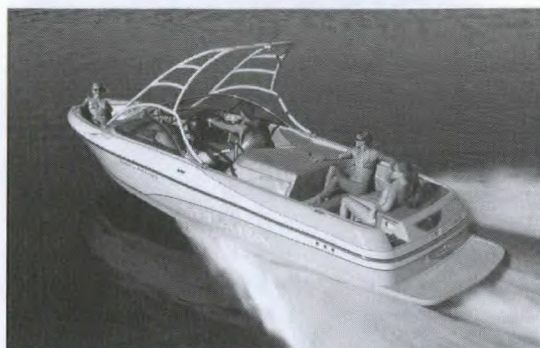
Le bateau-tracteur SV696 de la SVFARA.