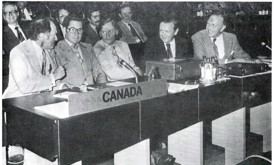
La délégation du Canada dirigée par le premier ministre Trudeau, à la Conférence d'Helsinki.

— nous avons accepté l'évolution inévitable des relations internationales mais nous avons tout de même reconnu le danger que représente l'instabilité dont elle s'accompagne et nous nous sommes engagés à tout mettre en oeuvre pour écarter l'hostilité et résoudre