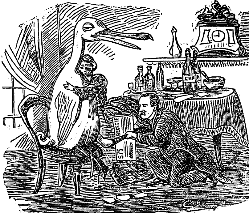
UNE SCENE DE FAMILLE.

Si la personne était un de nos bons abonnés la cane ne réussirait jamais à nous faire commettre une indiscretion.