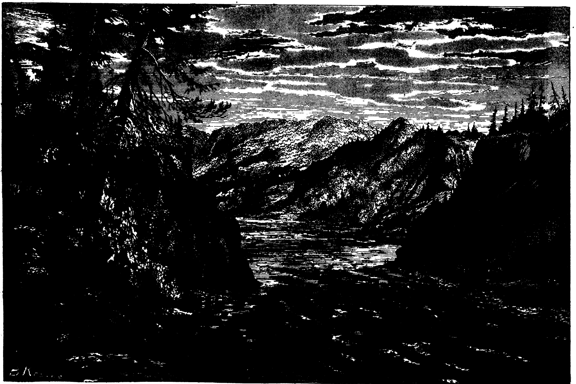
LE GRAND REMOUS DE NIAGARA.