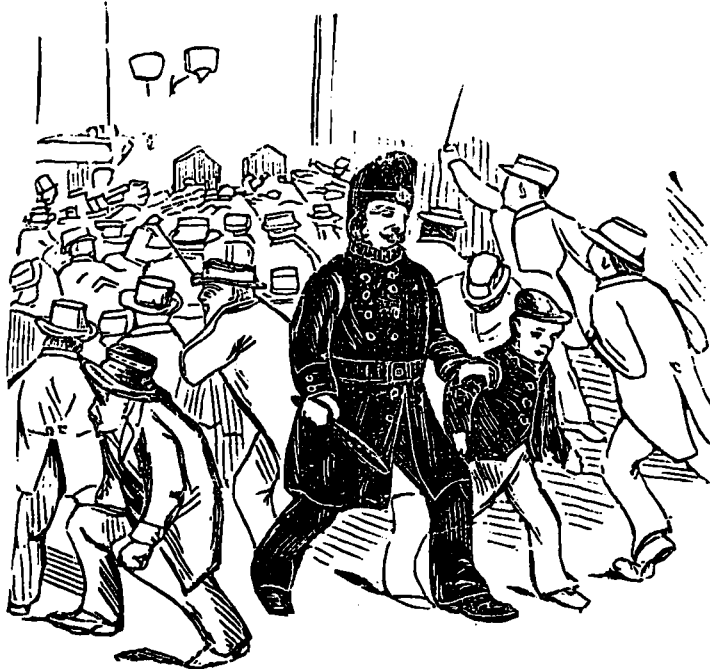
LE BRAVOURÉ D'UN POLICIER ANGLAIS LORS DE LA VENTE DES BILLETTS DE SARAH BERNHARDT.

Une maison, rue St-Jacques, Ville St-Henri—Estimation de la Corporation : $1,000—à vendre pour $1,000 en parts de Sociétés. Scierie dans le comté de Terrebonne, à quelques milles de St-Jérôme, ou plein bois et en fûts au beau lac Masson ; 61 acres de terre en bois debout, maison, etc., le tout pour $1,000, à $1,500 en parts de Sociétés. Scierie de St-Zotique, qui a coûté au delà de $7,000, et en opération, donne un profit net de $15 à $20 par jour, à vendre pour $5,000 en parts de Sociétés. Terre à St-Zotique, à trois arpents de l'Église : un des plus beaux sites à désirer. À vendre pour $2,500 en parts de Sociétés. Magnifiques lots à bâtir sur les rues St-Denis, Cherrier, Victoria, etc., à vendre pour des parts de Sociétés.