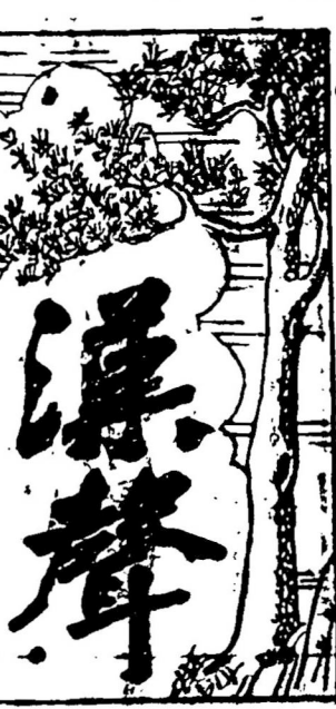
洪門信條 以義氣團結 以忠誠效國 以誠信待人 以廉潔除奸

THE CHINESE TIMES Established in 1907, it is the oldest Chinese newspaper in Vancouver. Published every day except on Sundays and holidays by The Chinese Press, Ltd., 400-410 Main Street, Vancouver 1, B.C.