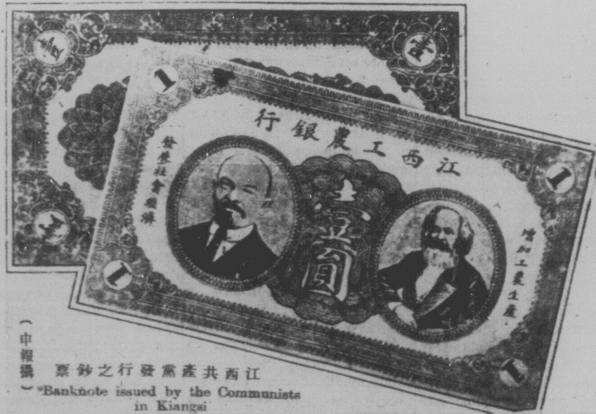
Та частина Китаю, що встановила в себе радянську владу та радянські закони, видає також свої гроші. На powyшому образку показано якраз такі грошові значки Радянського Китаю.