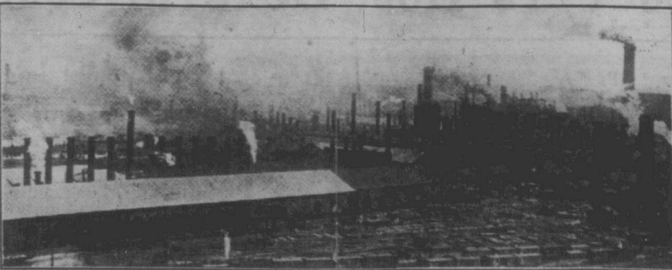
ЩІ ДИМИ З СОТОК КОМИНІВ РАДЯНСЬКОЇ СОЦІАЛІСТИЧНОЇ ІНДУСТРІЇ ПОКАЗУЮТЬ, ЩО В РАДЯНСЬКОМУ СОЮЗІ НЕМАЄ КРИЗИ.