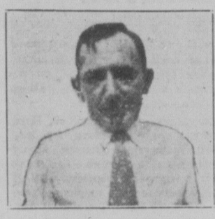
ЛЕОПОЛЬД — ЕСЕЛВАЙН

"свої власні гроші на партійні цілі", коли дістав на це інструкції від тих, які його післали за провокатора.