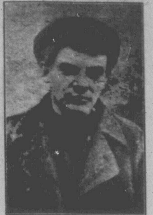
В. І. ЛЕНІН в перуці, з погонами аусами і бородою, під час слухач в Сестропецку, 1917 р., коли за ним шукала поліція тимчасового уряду.

Як-що я вирішу повернутися, так лише для того, щоб приєднатися до боротьби робітників та селян, для щастя яких Сун Ят-Сен віддав 40 років свого життя і яких тепер вбиває озвіріла реакція, що на хвості прикривається прапором Кумінтану. З тієї висоти, на яку підніс нашу революцію наш незабутній проводир через допомогу революційних сил всього світу, ви принизили її, дозволивши їй перетворитися в знаряддя для дрібних, підлих мілітаристів, що на сло-