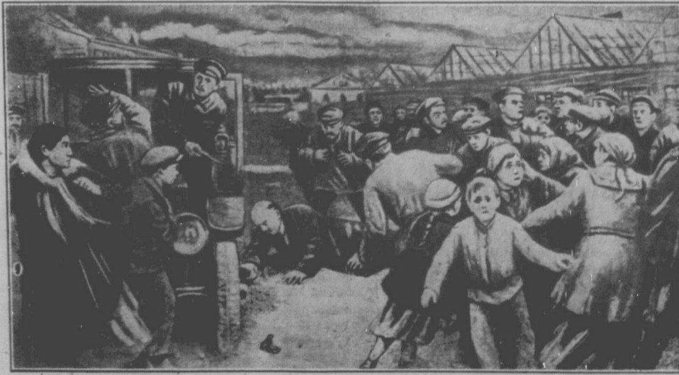
ЗАМАХ НА ЖИТТЯ ВОЛОДИМИРА ІЛЛІЧА ЛЕНІНА 30. СЕРПНЯ 1918 РОКУ.

Західно-українське селянство сильно заінтересоване виборами. Доказом цього вча, які відбуваються денеда самочинно без участі політичних партій. Замітний признако селянства вороже відношення до пропаганди УНДО. В багатьох місцевостях селяни заявляють, що голосувати будуть на тих кандидатах, що відносяться прихильно до Радянської України. Зокрема селянство обурене на угодві махінації Унда.