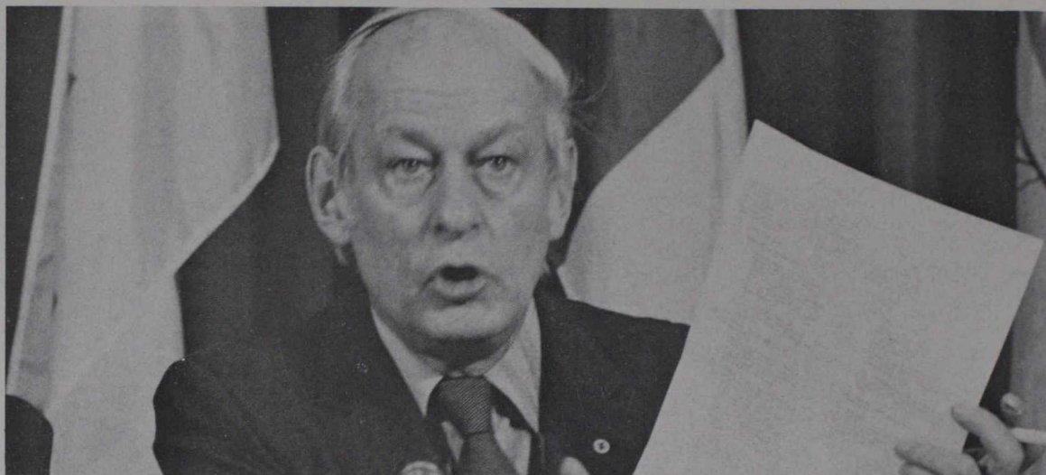
René Lévesque, Primer Ministro de la Provincia de Quebec, durante la Conferencia de Ottawa en 1981.

La conferencia terminó en desacuerdo como había sucedido en las anteriores, ya que las provincias y el gobierno federal no podían conciliar sus puntos de vista acerca de cómo modificar la constitución. Por lo tanto, el gobierno federal decidió realizar un movimiento unilateral y se introdujo al Parlamento una resolución, solicitando al Parlamento del Reino Unido la "patriación" de la constitución.