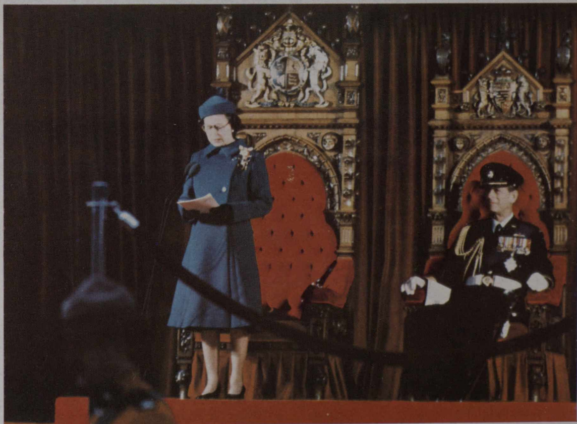
La Reina Isabel II durante la proclamación del Acta de la Constitución de 1982..

El acta puso fin a esta práctica anacrónica, por medio de la cual Canadá, una nación completamente soberana, tenía todavía que solicitar a un parlamento extranjero, el Parlamento del Reino Unido, que legislara los cambios en su constitución. Desde los años veinte y treinta, cuando Canadá logró su independencia completa, los canadienses habían tratado y fracasado en acordar entre ellos mismos acerca del proceso para hacer reformas al Estatuto de la América Británica del Norte. Las negociaciones entre los