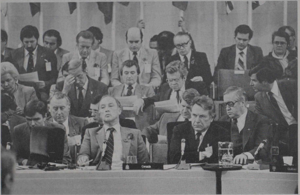
Conferencia de los Primeros Ministros Provinciales, Ottawa 1981.

gobiernos federal y provinciales entre 1927 y 1980, terminaron todas en desacuerdo. Finalmente se llegó a un acuerdo entre el gobierno federal y nueve gobiernos provinciales en noviembre de 1981, acerca del contenido del Acta de la Constitución, la cual incluye una fórmula reformativa. Así terminaron 55 años de desavenencias.