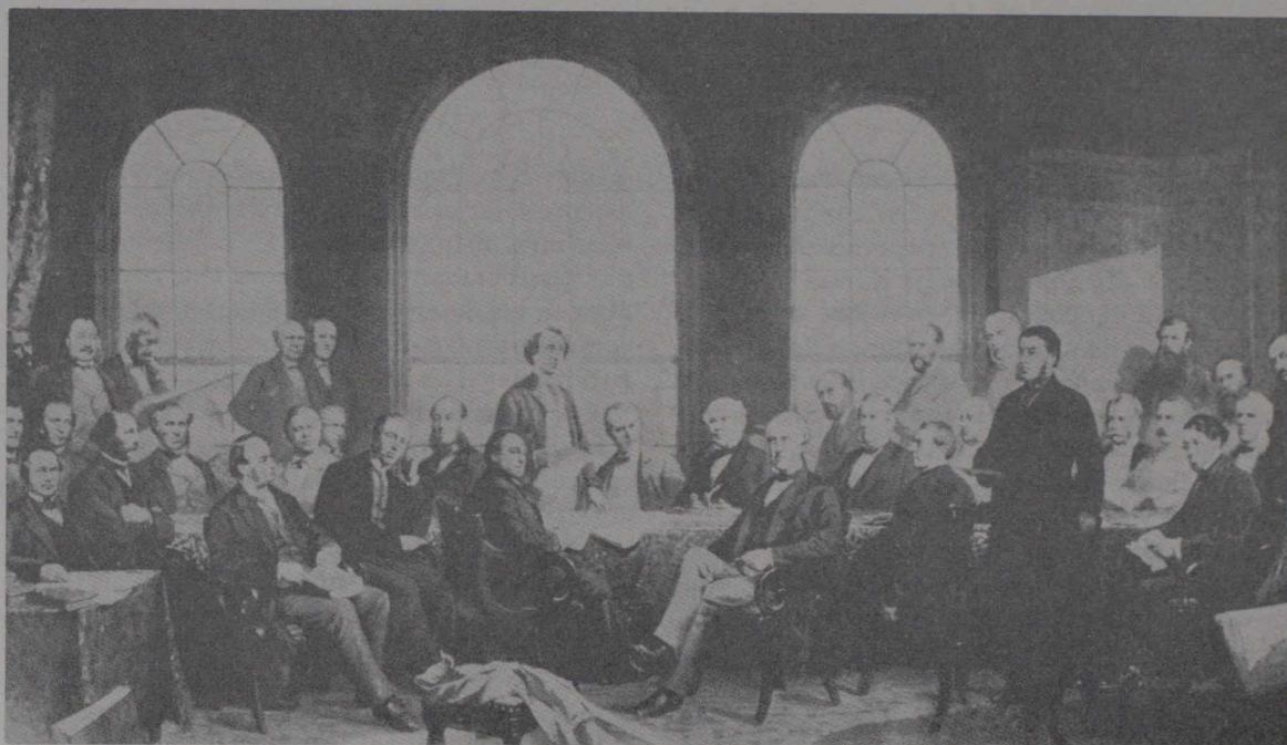
Los Padres de la Confederación.

expansión hacia el oeste. La visión de un Canadá extendido del Atlántico al Pacífico fue alcanzada finalmente en 1885, con la terminación del ferrocarril Canadian Pacific. Nuevas provincias se incorporaron al entonces Dominio del Canadá: Manitoba en 1870, la Columbia Británica en 1871, la Isla del príncipe Eduardo en 1873 y Saskatchewan y Alberta a principios del siglo siguiente. Terranova, la última provincia en incorporarse, ingresó en la Confederación en 1949.