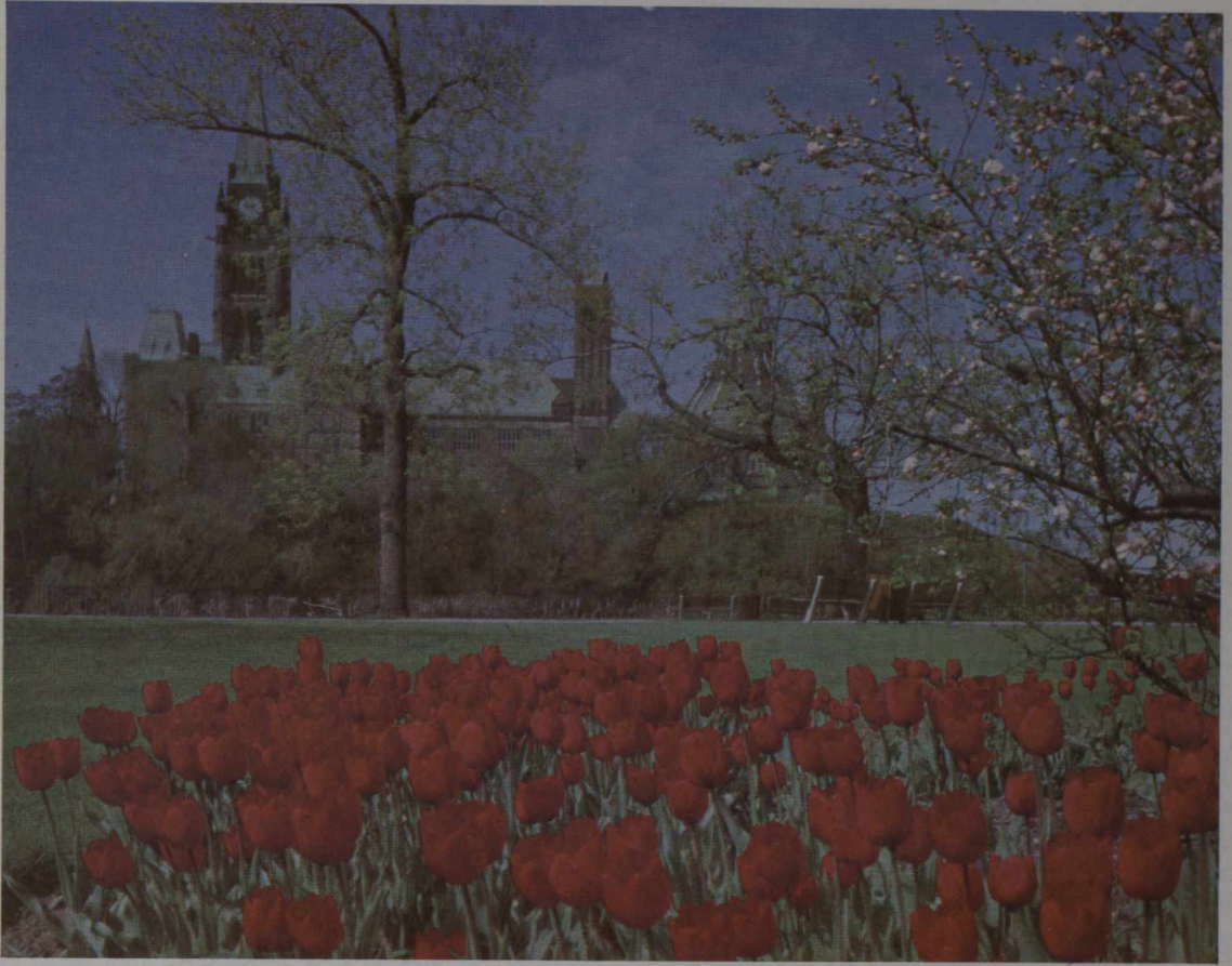
Colina del Parlamento en Ottawa.

Nuestra Portada: Ala Este de la Colina del Parlamento, Ottawa.