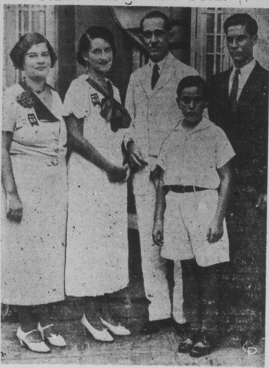
Dr. Ramon Grau San Martin, new president of Cuba, poses with a group of his relatives after assuming his new duties by appointment of the revolutionary junta.