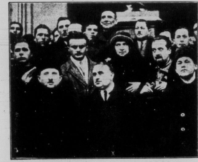
Австрійська робітничка делегація в С.Р.С.Р.