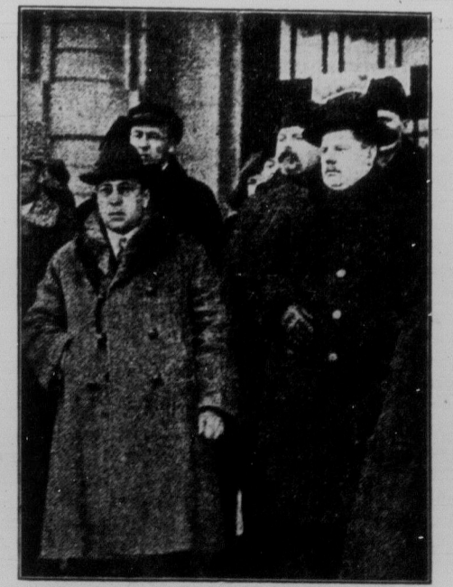
Делегати польського союму в С.Р.С.Р.

Отак, як бачите, — сидять на європейських смітниках царі, гетьмани й отамани та чекають, що "за два тижні" радянська влада. Десять літ вона вже "падає" для них "за два тижні", а вони чекають. Все голови й зуби їм розболілись, вже й капіталіст сердиться, істи не дає, бо пророчування не здійснюється. Водею, божим духом та надією жодні не на те, що більшовики пересаряться і впадут. Але більшовики не пересаряться, але на 15-му вессезонному з'їзді Компартії ще ліши змінилася. І не гірше засумували смітничові царі, гетьмани й отамани, ще гірше заболіли їх голови й зуби. Наша ім хлопська порада: "Не тратьте, куме, сили, спускайтесь на дно". Десять роковин радянської влади, це дев'ять основний кілок у вашу спину.