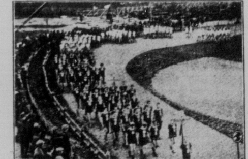
Радянські робітничі вільних від праці хвилях вправляють фізичний спорт корисний для здоров'я. На фотографії бачимо, як робітничі виходять до фізичних вправ на свій стадіон.

Туман яром котиться, Краще жить нам хочеться. Гей, гей, горе не біда, Краще жить нам хочеться. Тоді краще заведем, Як все панство проженем. Гей, гей, горе не біда, Як все панство проженем. Год нам катом сулять, Год нам в кайданах жить. Гей, гей, горе не біда, Год нам в кайданах жить. Год нам катом сулять, Ласки панської просить. Гей, гей, горе не біда, Ласки панської просить. Ласки панської все одні — Штук, кайдани, нагаї. Гей, гей, горе не біда, Штук, кайдани, нагаї. Ходім з панством воювать, Землю й волю добувать. Гей, гей, горе не біда, Землю й волю добувать. Товариство, пора встать, Лад радянський будувать. Гей, гей, горе не біда, Лад радянський будувать. Туман яром котиться, Вільно жить нам хочеться. Гей, гей, горе не біда, Вільно жить нам хочеться.