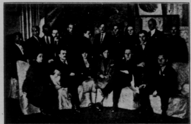
Англійська робітничка делегація в С.Р.С.Р., сфотографована з відповідальними робітниками рад. юнії в Ленінграді.

Нещодавно український уряд нагородив завод орденом Червоного Прапору.