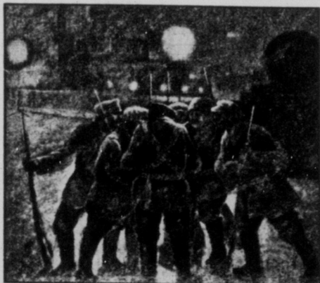
В трівижній ночі Жовтневої Революції 1917 року. Робітничая патруля на вулицях міста.

кожного люду та для захисту своєї радянської, робітничо-селянської влади від всіх її ворогів. Крім в руках червоноармії служить не для радничий й глоблення, лише є средством визволення пригнетених і навкаси средством відплати самим же гнобителям і дотеперішнім тиранам. Новий воєн-жовірі червоної армії — це озброєний пролетар, переловий борець революції. Він сповняє велике завдання — обороняючи здобутки революції перед її ворогами.