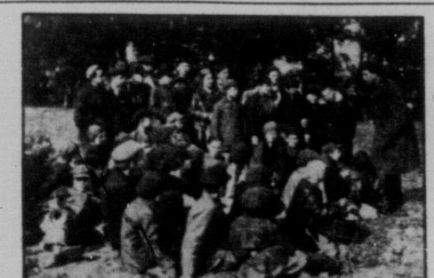
Молодь на Радянській Україні вийшла на прогулюк за місто, де інструктор на свіжому повітрі дає всім цікаву лекцію.