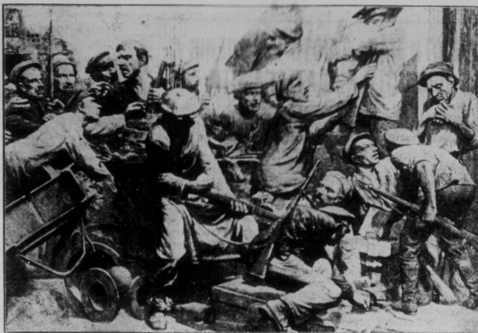
На фабриці в дні Жовтневої Революції 1917 року. (Картина артиста-малюва С. Карпова.)

Так жив капіталіст в негодному царстві; а робітник працював на нього все своє життя,