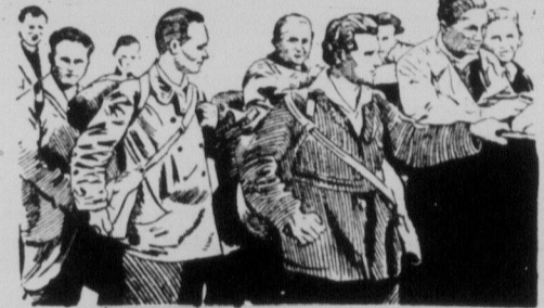
Члени німецької Комуністичної Спілки Молоді вибралися піхотою з Німеччини до С.Р.С.Р. Пішли три місяці, бо по дорозі заробляли працею на життя.