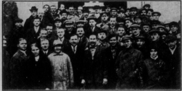
Чехословацька робітничка делегація в С.Р.С.Р.

Саме в той мент, коли в Харкові відбувається ця рільничу конференція, довідаємося з преси, що "князь української освіти" граф Шеншицький об'їждить нашу контрреволюційну еміграцію на Чехословаччині, де студентство сільсько-господарської академії, то є студентство,