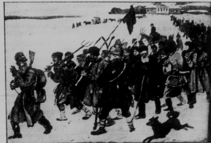
Повстання селян в перших днях Жовтневої Революції 1917 року. (Картина артиста-малюва Горелова.)

Товариші! Відновляйте передлагу на “Українські Робітничі Вісті”!