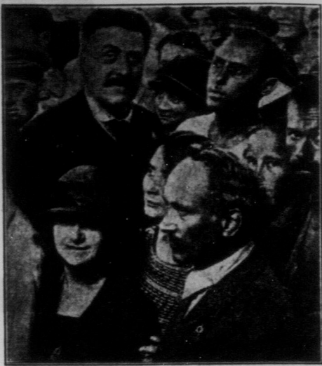
Бельгійсько-французька делегація вчителів і вчительок в Радянському Союзі.