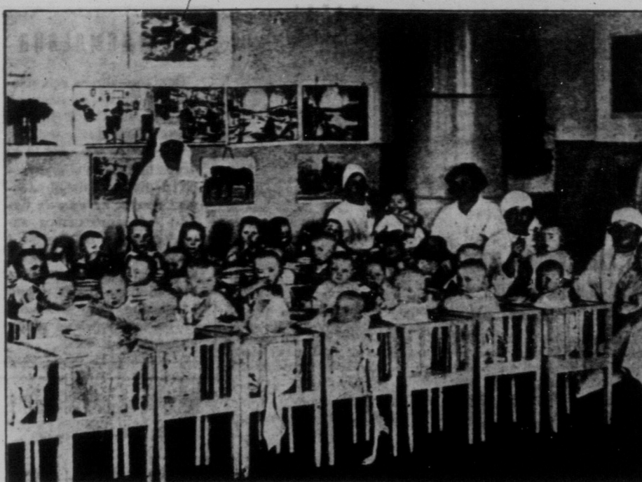
Охорона дітей в Радянському Союзі. Матері, що йдуть працювати, залишають своїх дітей в так званих дитячих садках, де їх поміють, одягнуть, нагодують, забавлять, ще й дечого навчать. За все це матері не платять нічого нікому. На нашій фотографії один з таких дитячих садків на Радянській Україні.

Секрет румунсько-польської індустрії 1926 року нічим не різниться від попереднього секрету. Ті самі прийоми, ті ж такі засоби. У Житомирі бу-