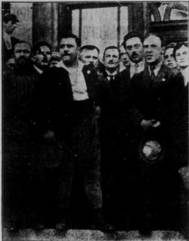
Друга німецька робітничая делегація на Радянській Україні.

По четверте — радянська влада міцна своєю господарністю. Спричинена війною господарська руїна стала одною з причин упадку старої влади. І ніяка інша влада не справилася б з тою продовольчою й промисловою руїною країни, чим це зробила радянська влада. Чому? Тому, що радянська влада дала можливість провадити боротьбу з руїною самій працюючій бідноті міста й села, допомагаючи їй для цього зорганізуватися.