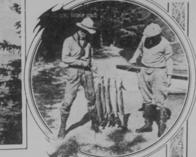
Bilder vom neuen Nationalpark, der von Premier Mackenzie...