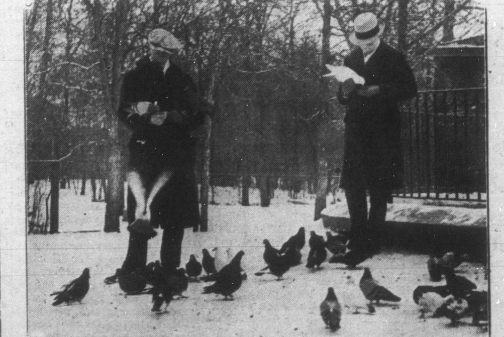
Az általában különben is szelíd kanadai állatok a téli beálltával még kevésbé rettegnek az em-bertől. A nagy hóesés miatt sok helyütt nem talált életre az állandóan ittartózkodó madár-sereg, úgyhogy az állatvédő egyesületek gondoskodtak azután ételmezésükéről.

GOLYÓÁLLÓ FAT talált fel két német ács Mönchsberg né-met városban. Két he'ly ácsme-ter s a falemez olyan preparálá-sát találta fel, amely a fát ellen-állóvá teszi tűzzel, vízzel, go-lyóval szemben.