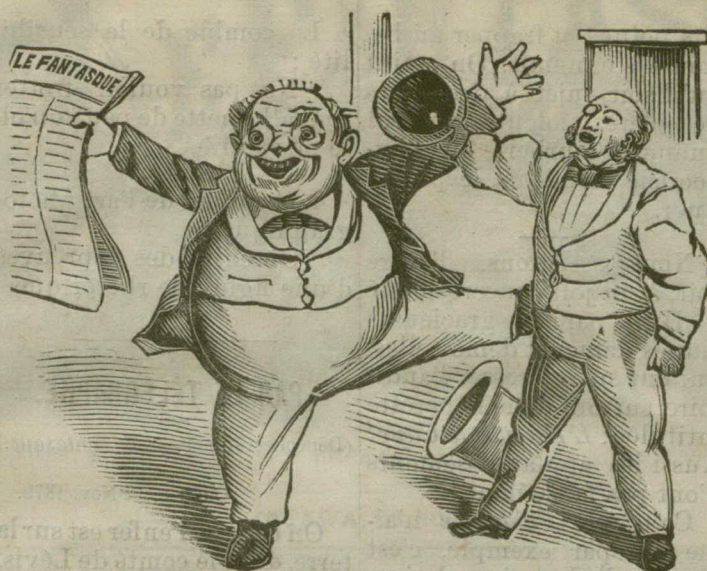
L'enthousiasme avec lequel le Fantasque est accueilli !!

« Le peuple, toujours trop bienveillant, n'a pas su comprendre la véritable grandeur