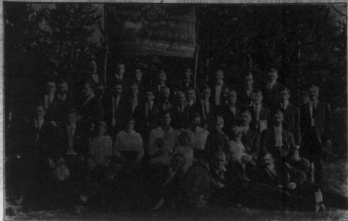
Відділ У. С. Д. П. в Кенмор, Альта.

В таких хвилях чоловік попадає в неописану злість і забуває навіть про обриту його небезпеку. Ми були вже близько Французів, коли один з них зашпортався і впав лицем до землі.