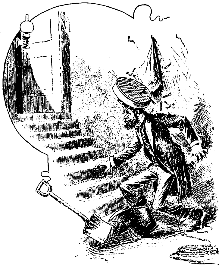
(Trois heures du matin).

Madame Christophe (du haut de l'escalier). — Quel est ce bruit-là en bas ?