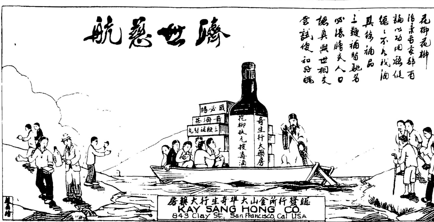
世界航運 KAY SANG HONG CO. 843 Clay St. San Francisco, Cal. U.S.A.

●馳名三鞭補腎丸大盒五元小盒三元 ●戰必勝丸 每盒二元 ●始創花柳扶元搜毒酒 每樽五元 ●花柳入骨搜毒丸 每樽五元