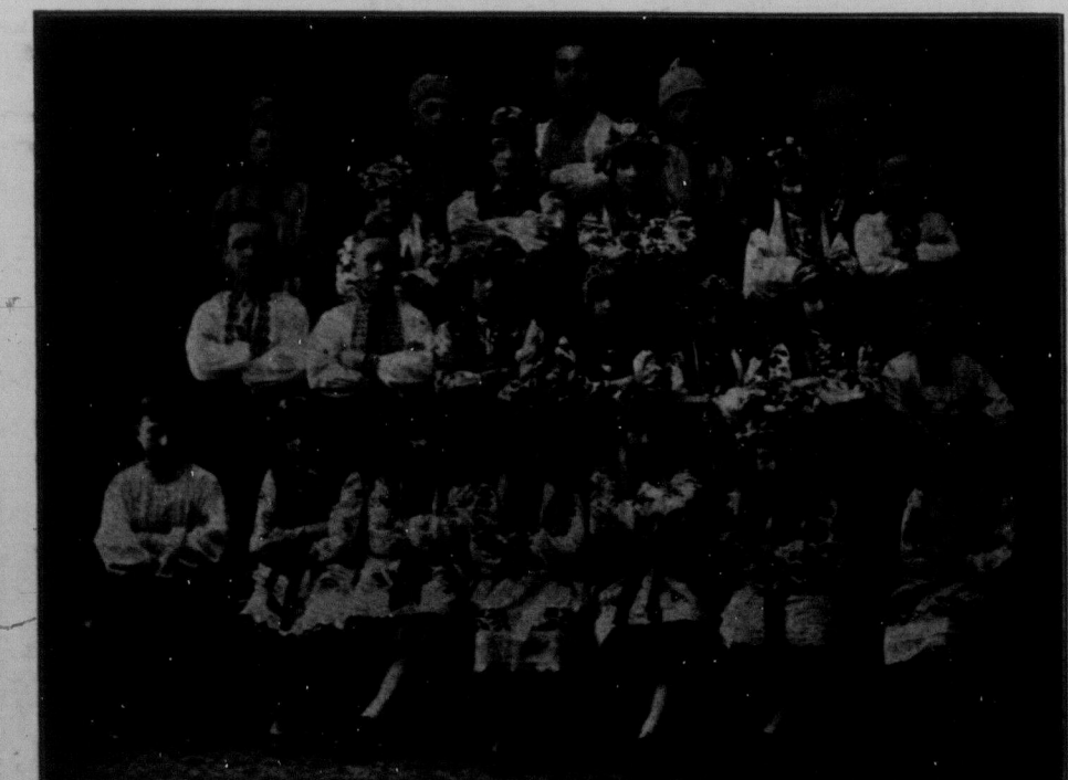
Група танцюристів і танцюристок при відділі ТУРФДім в Вест Торонто, Онт., що з великим успіхом виступали в торонтоських театрах.

Укр. лікар і хірург отворив свою лікарську канцелярію по двох-літній практиці в шпиталях Едмонтону. На листовні запити відповідає по українськи. Адреса: Room 201, Kitchen Block, 10164 A. — 101 Street, EDMONTON, ALTA.