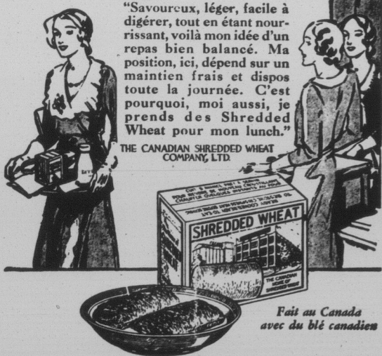
Fait au Canada avec du blé canadien

"Lorsque vous voyez autant de mets que moi dans une journée, vous venez à connaître les choses les meilleures et les plus saines à manger. Remarquez le cabaret de cette jeune fille qui vient de passer à mon comptoir — une boîte de Shredded Wheat et une bouteille de lait entier." "Savouroux, léger, facile à digérer, tout en étant nourrissant, voilà mon idée d'un repas bien balancé. Ma position, ici, dépend sur un maintien frais et dispos toute la journée. C'est pourquoi, moi aussi, je prends des Shredded Wheat pour mon lunch."