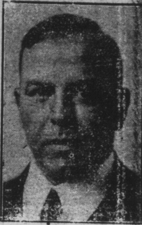
Premier Ministre du Canada, actuellement en Angleterre, dans l'intérêt du pays.