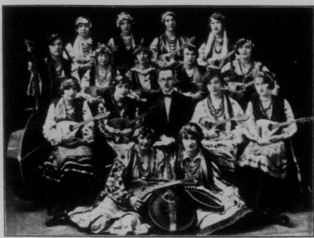
Дівоча Мандолинова Орхестра віділау ТУРФДім у Вінніпегу!

В середу, 6 липня Дівоча Мандолинова Орхестра віділау ТУРФДім у Вінніпегу вилізть в далеку концертну подорож в сідну Канаду по такій лінії: Вінніпег — Кенора — Форт Вільям — Салт Сейнт Мері — Сдабори й околиця — Торонто — Гемилтон і околиця — Віндсор — Детройт — Торонто — Монреал — Оттава — Норт Бей — Тіммінс і околиця — Вінніпег. Орхестра віділає також цілий ряд менших міст і місточок та вступить до близьких від канадського кордону місцевостей в Злучених Державах. За цей час зробить вона поверх 5,000 миль дороги й дасть коло 60 концертів. Бажаємо нашій орхестрі щасливої дороги і гарного успіху.