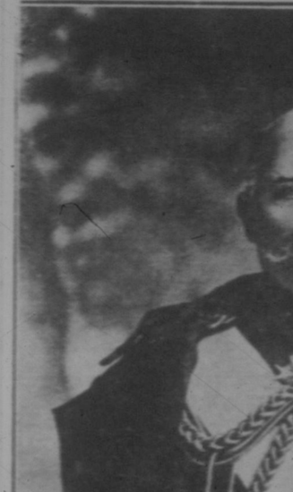
Seine königliche Hoheit, Herzog Arthur von Connaught, der im kommenden Herbst seinen Thron als Generalgouverneur von Canada aufgeben und nach England zu ziehen wird.

Montag, den ersten Juli, wurde Regina durch den Besuch seiner königlichen Hoheit, des Herzogs von Connaught, General-Gouverneur von Canada, dessen Gemahlin und Prinzessin Patricia, beehrt.