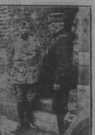
General Joffre und General Foch.

Der müßig geht, fängt leicht Grillen, lautet ein Ausspruch meines Großvaters, an den ich immer denken muß, sobald ich auf lauernde Pfenden stehe.