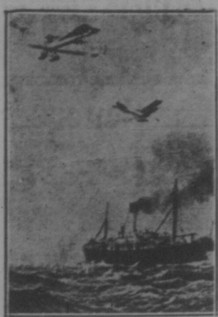
Deutsche Zieger greifen einen englischen Transportverband an.