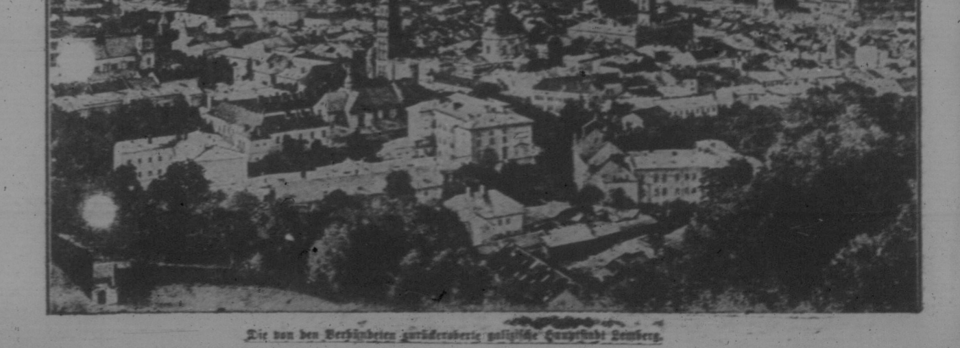
Die von den Verfassern gezeichnete gütige Ansicht von Regina.