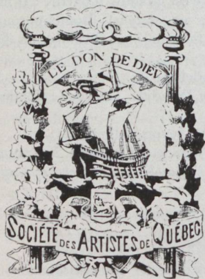
Le symbole de la Société des Artistes Dessin de M. Chs. Huot.

LES lecteurs du Terroir savent maintenant que la Société des Artistes de Québec, s'est jointe, récemment, à notre Société. Les peintres se sont souvenus que l'union fait la force. Ce geste est à l'honneur de nos artistes, car leur précieuse collaboration aidera grandement au développement des arts et des lettres à Québec.