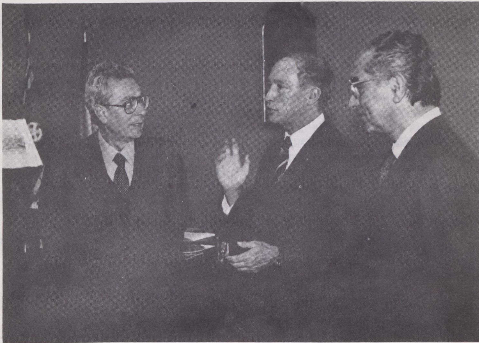
El Primer Ministro Trudeau (centro) conversa con su homólogo italiano Arnaldo Forlani (izquierda) y el canciller Emilio Colombo (derecha).

El Primer Ministro Pierre Trudeau visitó Argelia del 15 al 19 de mayo para mantener conversaciones con oficiales argelinos sobre asuntos bilaterales y el problema Norte-Sur.