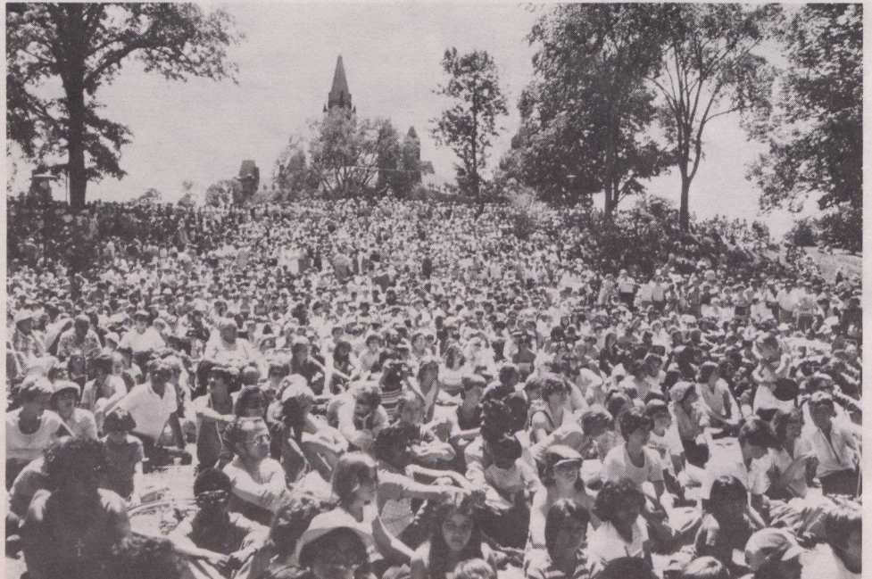
Se espera que las cifras censales para 1981 muestren un 5.9 p.c. de crecimiento demográfico.