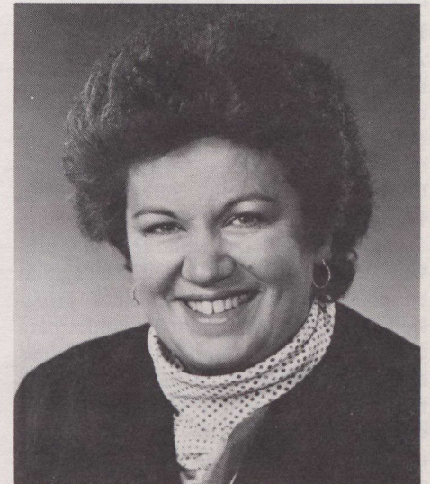
La Ministro de Salud Monique Bégin

la señorita Bégin. En Canadá existe una variedad de programas federales y provinciales destinados específicamente a solucionar algunos de estos problemas, a saber: “diálogo sobre la bebida”, “operación estilo de vida”, “participación”, y “guía alimenticia de Canadá”. Además, el gobierno federal ha iniciado recientemente un programa para disuadir a los jóvenes de fumar y un programa de nutrición llamado “equilibrio”.