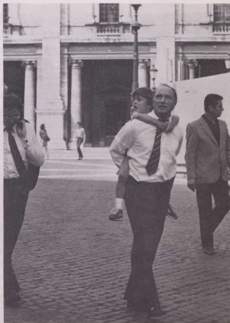
El Primer Ministro Trudeau y su hijo Michel paseando por Roma.

los países pobres. Argelia desearía celebrar una gran reunión cumbre mundial mientras que Canadá está dispuesta a tomar una actitud gradual y ha sometido diversas propuestas para ser negociadas, tales como una afiliada energética al Banco Mundial que implicaría la participación del Tercer Mundo.