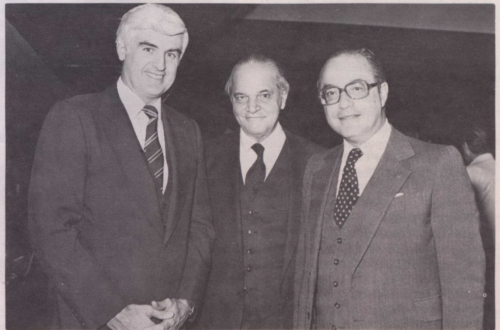
S.E. el embajador brasileño en Canadá Geraldo de Carvalho Silos (centro) al lado de su compatriota gobernador Maluf de San Pablo (derecha) y el Ministro de Comercio canadiense Ed Lumley.

El anfitrión del gobernador en Ottawa fue el Ministro de Comercio honorable