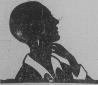
פאראנאכט זיך וועגן דער הארז!