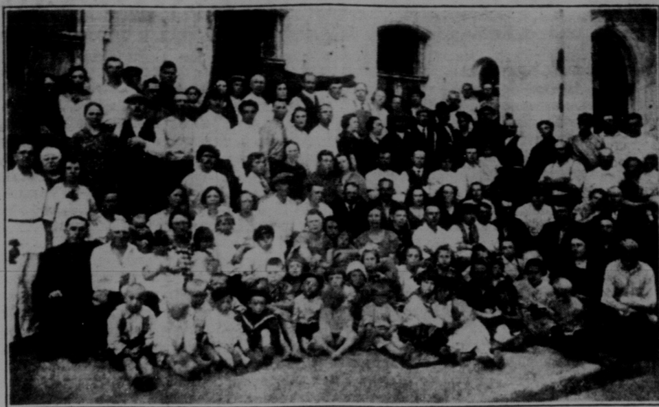
Знімка членів канадійської комуні в Мигаєві в 1927 році.

стя надіхала підвода з комуни, що привезла фільми для пересілки в Одесу. Сів, поїхав. Казали мені, що з станції з половиною милі, а ми ідемо і ідемо. Дорога в замерзлій груді, коні не можуть швидко їхати, мені (видикшому) відбиває печінку, але — я держуся міцно, балакаю з хлопцями-погоничем, вже тутешнім, що вступив в комуни. Миледео в балці сльозе. Потім знову степом, та знову в балку. Де ж комуна? — питаю. Та ось зараз. І коли ми вихали в нову балку (яр), в долині заблестів ви-