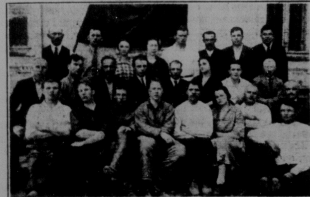
Партійний Осередок при комуні в Мигаєві в 1927 році.

Вранці хтось постукав в двері і повідомив, що час снідати. Я одягнувся і вийшов на двір. Перед моїми очима багато ріжних розмірів будинків, що відкрили ціле узгір'я. Вже в ідалі до мене приступили товаришки, що колись були в Канаді. Почав мчався темною ніччю, а я був неспокійний, бо не знав, де саме висідати мені. Але селяне, що їхали в тому ж вагоні, заспокоїли. Канадійську комуни вони знають добре, скажуть де висісти. Десь біля 12-ої в опівночі я й висів. Невеличка станція Мигаєво серед степу. Я оглянувся за спідодом. З комуни нікого. Телеграму послав і пізно і коли спитав на телеграфі, чи доручена вона комуни, дістав відповідь, що ні. Становище погане. Дороги я не знав, а на дворі і ніч і морозний вітер. На ша-