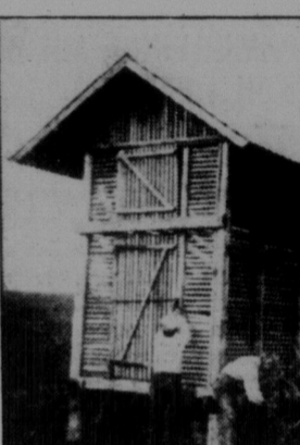
Кім для кукурузи (кішниця) в комуні.

Цілими днями знайомилися з господарством "Першої Канадійської Зразкової Комуні ім. Леніна в Мигаєві". В затишній балці, на цілому узгір'ї, розложилось 29 великих будинків, з них більшість нових, збудованих вже комунарами. Житлова криза, себто з помешканнями для комунарів, ще не ліквідована. Живуть тісно, ніхто покищо не має більше, як одну кімнату. Але це часове. Вже з весною мають приступити до будови величезного мешкального будинку і столової-ідалі. А покищо — тиснуться в невеликих кімнатах. Має комуна 1,638 гектарів землі, з того 1,506 гектарів для управи, решта пасовище. В господарстві є 49 штук прекрасних коней, 11 тракторів, 100 расових корів німецької породи, 115 англійських свиней, 1,074 штук овець, 700 штук домашньої птиці (кури, гуси, індики), 20 штук телят і лоша. На сьогоднішній день в комуні