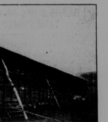
Кім для кукурузи (кішниця) в комуні.

тами, салею і сценою. Весною його докінчать. Є в комуні гарна бібліотека, комунарі індивідуально передплачують загально 110 газет і журналів 40 ріжних назв. Мають великий радіо-апарат, яким слухають не лише Радянський Союз, але й цілу Європу. Окрім газет і журналів передплачують поодинокі твори Леніна, велику радянську енциклопедію і інші книжки. Має комуна свій овочевий сад до 500 дерев, а з весною засаджують нових 1000 цсп. В саду початок великої пасіки, що досі має 98 пнів. Під виноград, що тут дуже добре вдається, відведено 55 гектарів землі і треба визнати, що вино продукції комуни має свою широку славу. Крашого вина я ніколи не пробував. Саме до комуни приєднались два найближчі селища: Мигаї і Майорське, що все своє майно передали в комуни. До 202 дотеперішніх членів комуни добавили нових 170 та землі 500 гектарів. Всі селяни, що