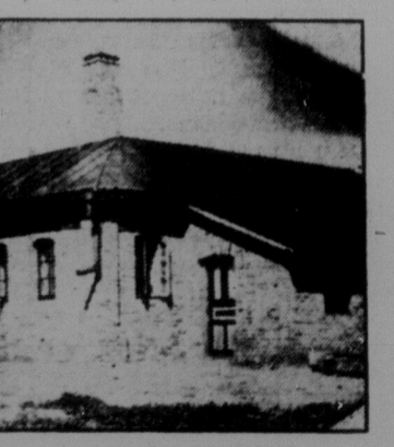
Комунальна водокачка і лазня, збудована 1928 р.

досі господарювали індивідуально — стали добровільно комунарами. З канадійців в комуні є на сьогодні 45 чоловік. Дійсно зразково збудований великий амбар та корівник, роботи комунального самоучки-архитекта т. Порайка (з західної Канади). Порядок в стаїх зразковий. Кожна корова має свою назву і "модерне" стилі та харчову норму. Це саме і з свинями та кнми. Більшість худоби вже вихована самою комуною. До Одеси через кооперацію комуна доставляє молоко, бриндзю, яйця. Є в комуні кооперативна крамниця, де можна дешево достати всякий крам. Всі члени комуни є одночасно членами кооперативу. Два рази в тиждень комунари купуються в своїй паровій лазні, збудованій вже ними самими. За працю одержують комунари окрему платню кож-