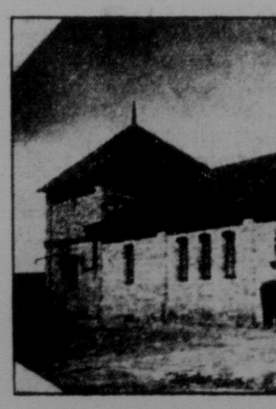
Комунальна водокачка і лазня, збудована 1928 р.

є 202 членів, з того 58 дітей, досі господарювали індивідуально — стали добровільно комунарами. З канадійців в комуні є на сьогодні 45 чоловік. Дійсно зразково збудований великий амбар та корівник, роботи комунального самоучки-архитекта т. Порайка (з західної Канади). Порядок в стаїх зразковий. Кожна корова має свою назву і "модерне" стилі та харчову норму. Це саме і з свинями та кнми. Більшість худоби вже вихована самою комуною. До Одеси через кооперацію комуна доставляє молоко, бриндзю, яйця. Є в комуні кооперативна крамниця, де можна дешево достати всякий крам. Всі члени комуни є одночасно членами кооперативу. Два рази в тиждень комунари купуються в своїй паровій лазні, збудованій вже ними самими. За працю одержують комунари окрему платню кож-