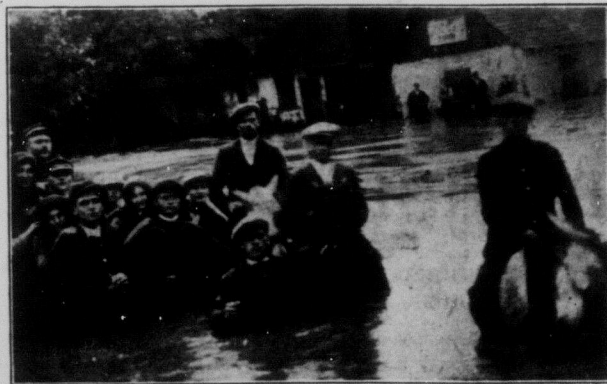
На цій фотографії показано, як вода залляла містечко Рожечків, повіт Долина. Фотографію отримав з дому один з читачів "У.Р.В." й прислав нам до поміщення.

Повінь на Підкарпатті по-робила страшні спустошення, головне серед робітництва і бідного селянства. Десятки тисяч родин не мають що в рот взяти. В деяких місцевостях вже кинувся голодний тиф. Доми по містах і селах порозвалювані, або сильно ушкоджені. Надходять зима грози, що найбільшим спустошенням серед голодуючої бідноти.