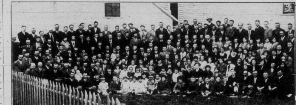
Делегати й делегатки — та члени й членки українських робітничих організацій в Едмонтоні — на п'ятий провінційний з'їзд ТУРФД, що відбувся в Укр. Роб. Домі в Едмонтоні в дні 10, 11, і 12. червня 1926 року.