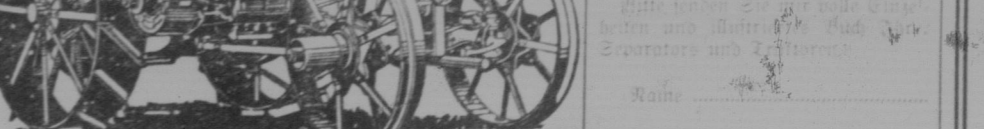
Minneapolis Threshing Machine Co. 17-30 4 Cylinder Oil Tractor

Die Minneapolis Separator Co. hat eine neue Methode entwickelt, um Getreide vor Schädlingen zu schützen. Diese Methode ist wirksam und umweltfreundlich.