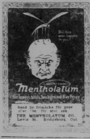
Hand De främsta för sport... THE MENTHOLATUM CO. LEWIS ST. BRIDGEPORT, ONT.

Amerikanerna ha skyndat att för en, som de trodde, häpnadsväckande framtid. "Världens största flygmaskin" De på tekniska vidunder tydligen baserade europäerna ha emellertid blandat majoritet i glädjebägaren och skakat till den stolt självbevettvede Oskel Sam, genom att säga, att det där var ingenting att komma med. England har redan en flygmaskin, som är mycket större, och Tyskland åstadkom under kriget tekniska vidunder i flygmaskinväg, som ställa de amerikanska mästare stycket fullständigt i skuggan. Amerika får alltså ta ett bättre krafttag, då det nästa gång vill slå Europa med häpnad.