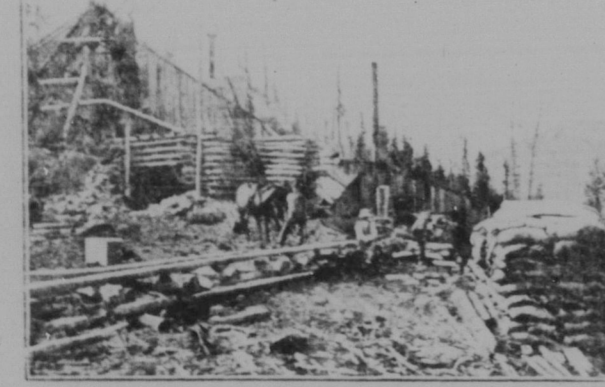
En bild från gruvindustrien i B. C.

Nästa "stopover" gjordes i Prince George, där det finnes ett ej så ringa antal skandinaver. Även denna stad är en s. k. divisionspunkt samt