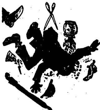
Enfin, le Monsieur qui vient se p'atndre au bureau qu'on s'est moqué de lui dans Le Farceur .