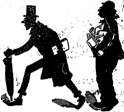
Notre poète attitré

La grande, l'inénarrable faveur avec laquelle Le Farceur a été reçu chez un certain public, nous engage à donner aujourd'hui les portraits fidèles de nos rédacteurs, administrateurs, artistes, porteurs et de notre ménagère. Nos lecteurs comprendront quelle importance il y a pour eux de se trouver bien renseignés sur les personnalités intéressantes que nous leur présentons.