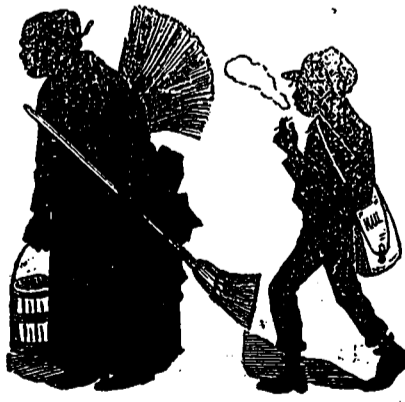
Notre honorable ménagère