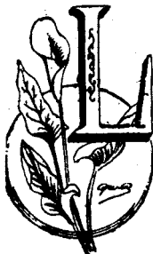
LILY BALM Trade Mark