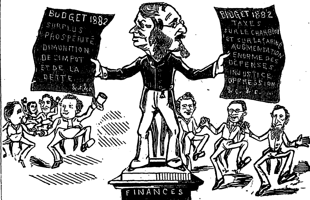
LES FINANCES DU PAYS.

Les chiffres ne mentent jamais, cependant chacun voit dans l'exposé budgétaire, ce qu'il désire y voir et rien autre chose.