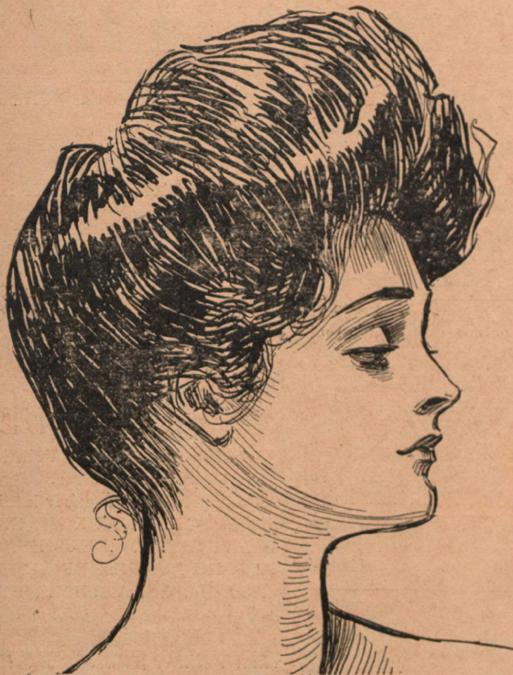
TETE DE FEMME d'après GIBSON

Un an - - - Quinze francs Six mois - - - 7 frs Strictement payable d'avance.