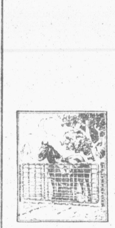
Barrières de fermes FROST

Les barrières de fermes Frost sont la solution pour vos barrières. Elles résistent aux plus fortes secousses, elles sont durables et faciles à installer. Elles sont aussi très économiques.