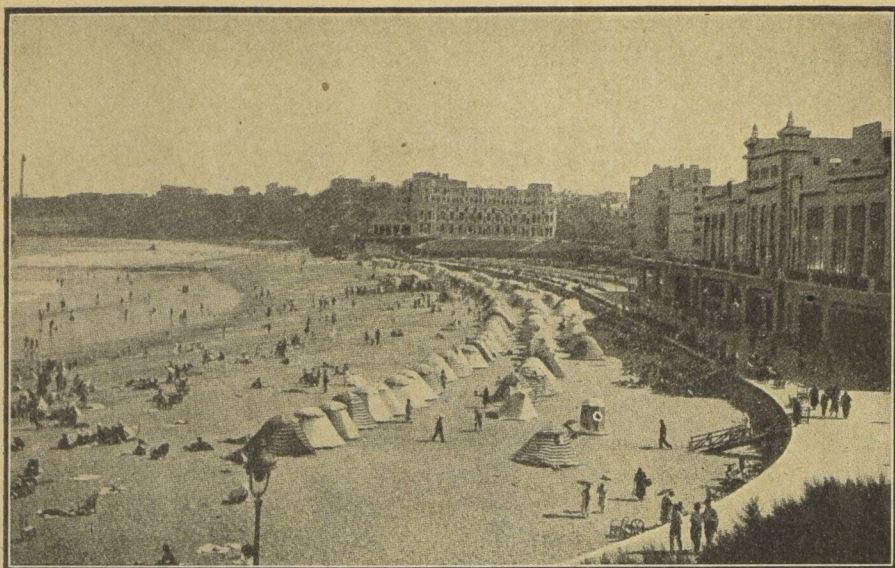
Biarritz—la célèbre plage française, rendez-vous de l'élégance mondiale.

Lucerne, Murray Bay, Londres, Biarritz, quelque soit l'endroit où vous puissiez aller — quelles que soient les personnes que vous puissiez rencontrer . . .