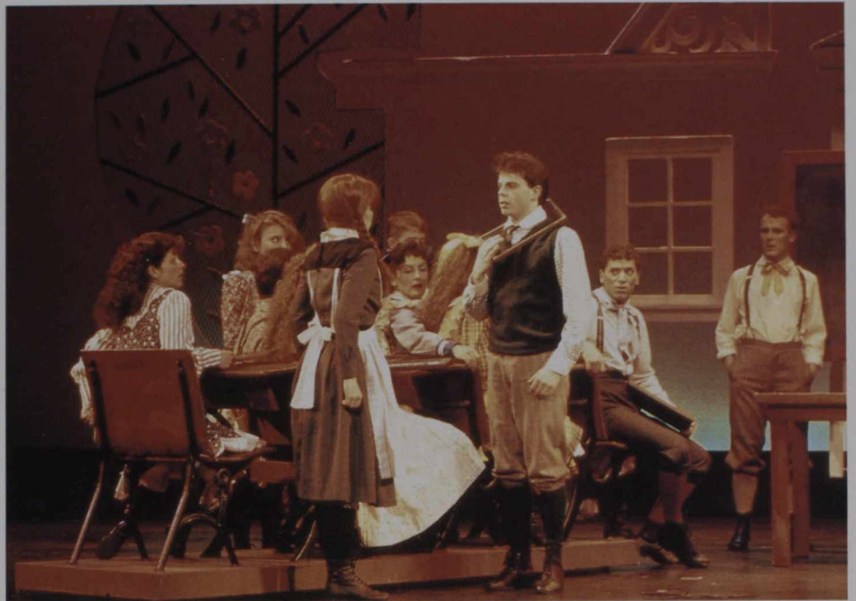
ミュージカル「赤毛のアン」。

上映館は、Bunkamuraのル・シネマ2、東京・青山の草月ホール、東京・吉祥寺の