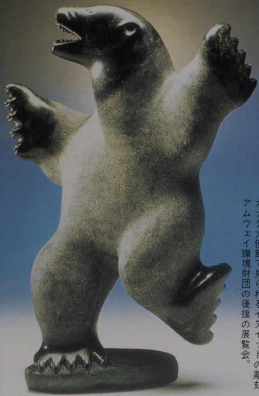
カナダ大使館で見られるイヌイットの彫刻。 アムウェイ環境財団の後援の展覧会。

エドワード島を訪れ、このミュージカルを楽しんだ。日本からも、1989年だけで1万人のファンがフェスティバルを訪れている。毎年、本場シャーロットタウン・フェスティバルで上演されるミュージカル「赤毛のアン」が、今年はオリジナル・キャストもそっくりそのまま、日本へやってくるわけだ。