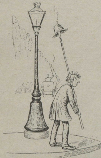
LES DISTRAITS DE G. RI

— Ce n'est pas une poule, mais bien une casquette qui rapportait à un propriétaire plus d'or qu'il n'en voulait. Voici le cas, assez amusant: Un organiste de Saint-Petersbourg s'achète une casquette de voyage et s'en coiffe immédiatement. Rentré chez lui, il trouve dans sa poche deux porte-monnaie bien garni dont il ne peut s'expliquer la provenance. Le lendemain et les jours suivants, même sortie et même rentrée avec quatre et six porte-monnaie. Positivement affolé, le brave homme va raconter son aventure au commissaire de police qui lui explique que cette richesse inattendue lui venait du port de sa casquette, couvert-chef spécial d'un chef de voleurs à la tire, que ceux-ci, très fidèlement, lui remettaient le produit de leur travail. A leur point de vue, les voleurs ont leur honnêteté... professionnelle.