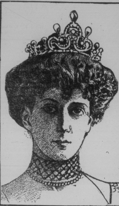
Prins Carl och Prinsessan Ingrid Norges Nyvalda Konungapar.