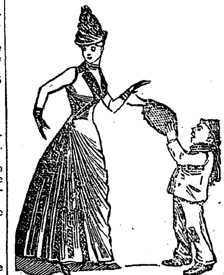
GAVROCHE—Est-ce que ceci vous appartient, mademoiselle?

Un homme prudent: Lorsqu'il va quelque part avec son fils et qu'on lui demande: —Quel est donc ce jeune homme? Il ne manque jamais de répondre: —C'est le fils de ma femme.