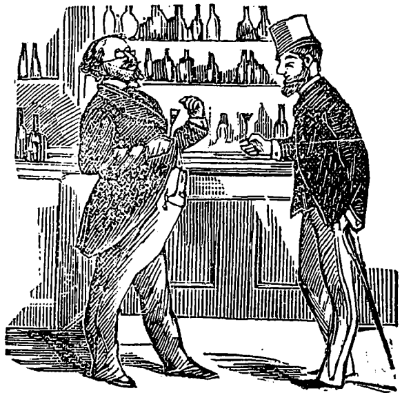
Le marchand de vin a une nouvelle pratique—Ah! je sais d'où vient ce vin. Des rives du Gag, en France; une magnifique place! Quelle belle scène que les vendanges!